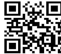
Aktion 1000 Obstbäume

Dann unterstützen wir Sie gerne mit Obstbäumen aus sächsischen Baumschulen!